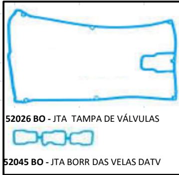
52026 BO - JTA TAMPA DE VÁLVULAS