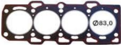
52002 SC - 2,0 MM - CIL. 83 MM 52002 KT - 3,0 MM - CIL. 83 MM 52002 TB - 2,5 MM - CIL. 83 MM JTA CABEÇOTE